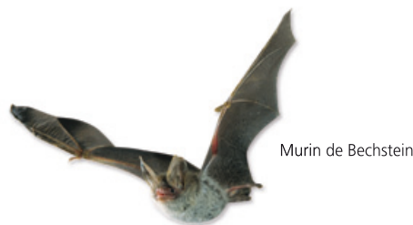
Murin de Bechstein

LPO France 06 71 13 48 71 guillaume.planche@lpo.fr