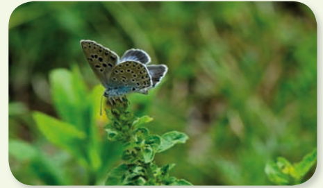
L'azuré du serpolet

(lisières herbacées, haies, bandes enherbées...), augmenter leurs ressources alimentaires en implantant des plantes nectarifères et en arrêtant les pesticides, etc.