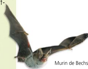
Murin de Bechstein

Tout propriétaire en site Natura 2000 peut ainsi s'engager de manière volontaire dans les deux outils que propose Natura 2000 : la Charte et les Contrats.