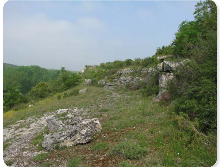
Le coteau de Fontauray, un site au enjeux multiples