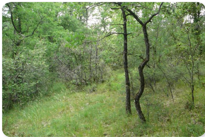
les pelouses calcaires soumises à la fermeture du milieu