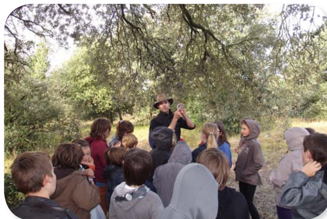
Les élèves des écoles aux alentours sensibilisés à leur patrimoine naturel

Après les collégiens de Châteauneuf en 2012, ce sont les 20 élèves de CE2-CM1-CM2 de l'école de Bonneuil qui ont pu découvrir le massif des Chaumes Boissières au travers d'activités nature en octobre 2013. Après un tour d'observation et d'identification par la couleur et l'odeur les différentes plantes présentes sur les zones de pelouses, les enfants ont attrapé et observé les insectes (zygènes, papillons, mante religieuse...) avant de leur rendre leur liberté.