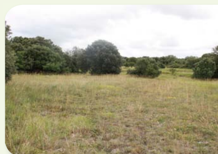
Les pelouses d'Angeac-Charente