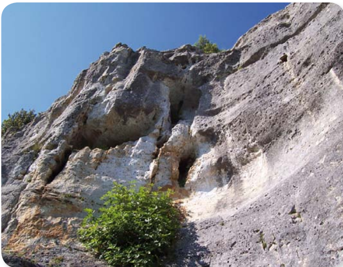
Le site de la Font-qui-Pisse est, après le site des Eaux Claires à Puymoyen, le second site régional d'escalade

Les falaises disparaissent derrière un rideau végétal. Il est donc nécessaire de rendre à ce site ses qualités paysagères d'autrefois et d'en préserver le patrimoine naturel.