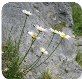
La Marguerite à feuilles de graminée se distingue de sa cousine, la Marguerite commune, par ses feuilles allongées et étroites

A l'occasion de la sortie nature annuelle organisée dans le cadre de l'animation du site Natura 2000, une vingtaine de personnes a pu découvrir ou redécouvrir la faune, la flore et les paysages géologiques du coteau de la "Font qui pisse".