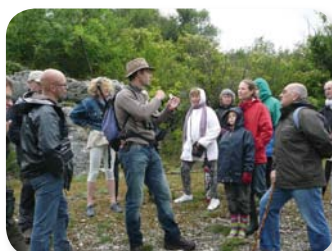
Une vingtaine de participants ont répondu présents à l'invitation de Charente Nature et de la LPO ce samedi 10 mai 2014

Au contraire vous n'étiez pas disponible ? Manifestez-vous auprès de l'animateur du site, il vous communiquera la date de la prochaine animation !